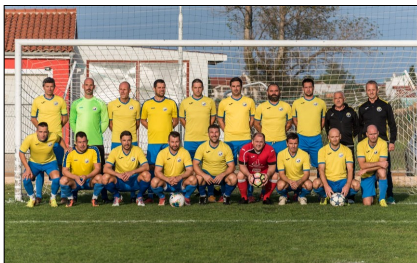
Prvaci LV NS Zadarske županije, sezona 2020./2021., Sabunjar Privlaka