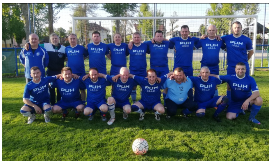
Prvaci 2. ŽNL NS KKŽ, sezona 2020./2021., Ferdinandovac veterani