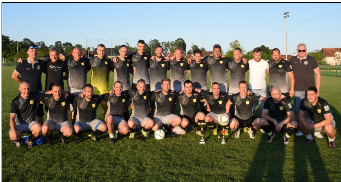
Prvaci LV NS Velika Gorica, sezona 2020./2021., veterani NK Mladost Obrezina