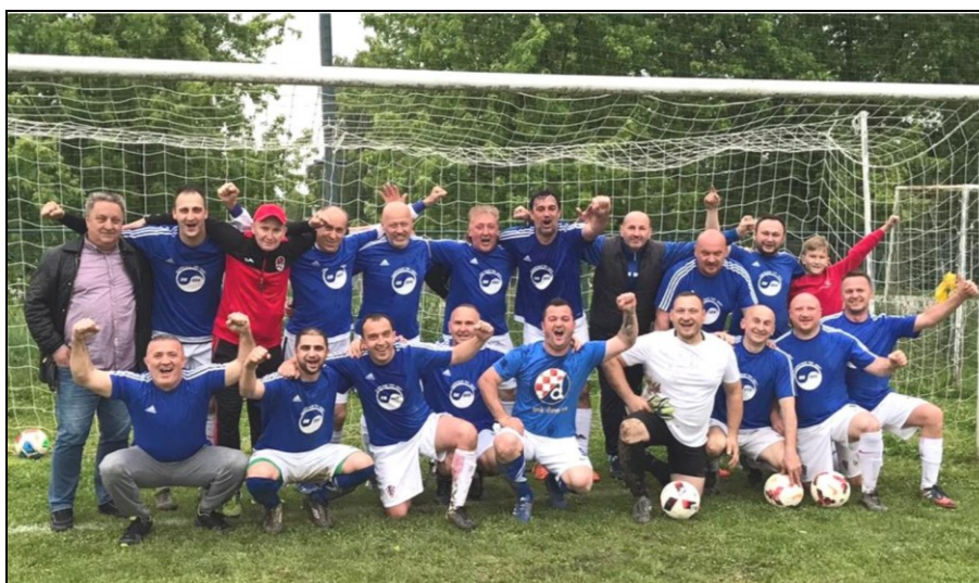
Prvaci 2. Lige skupina „A“ ZNS-a, sezona 2020./2021., Horvati Mešić com