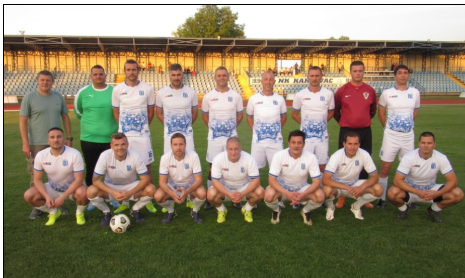
Prvaci LV NSKŽ, sezona 2020./2021., Karlovac 1919 veterani