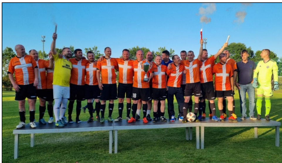
Prvaci II ŽNL veterana NS KZZ, sezona 2020./2021., Tondach, Bedekovčina