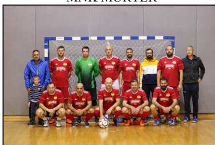
MNK BANZOGO FUTSAL