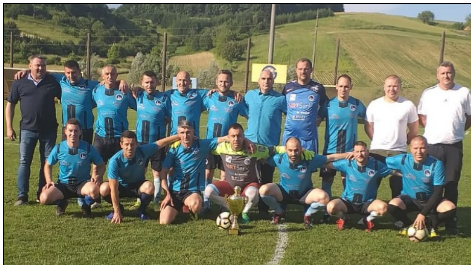
Prvaci LV NS Dugo Selo, sezona 2020./2021., Dugo Selo veterani