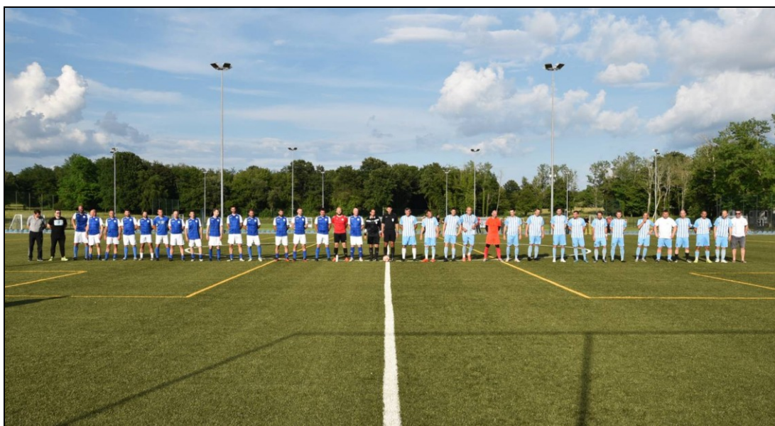
Finalni susret za prvaka veterana NSŽI (Jadran Poreč – Pazin veterani)

Na kraju prvenstva sukladno propozicijama za natjecanje odigrane su utakmice razigravanja za ukupnog prvaka veterana NSŽI. Na žalost pobjednik skupine JUG (momčad Istra Pula) zbog igračkih problema odustala je od nastupa pa su za prvaka razigravale samo momčadi Jadran Poreč i Pazin veterani (pobjednici skupina Sjever i Centar). Odigrana je jedna utakmica u Poreču, gdje su veterani Pazin veterani bili uspješniji od Jadrana 3:1 i tako obranili titulu od prošle sezone!