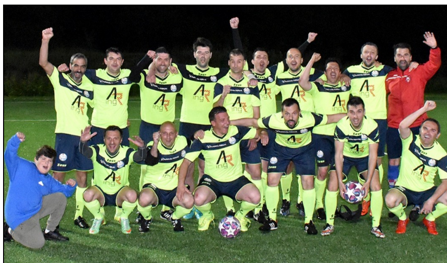
Prvaci 1. Lige skupina „B“ ZNS-a, sezona 2020./2021., Tora, Zagreb