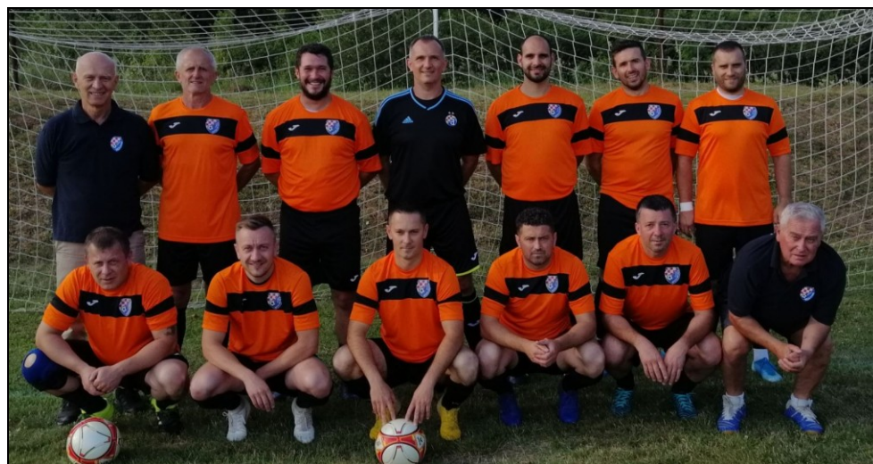
Prvaci lige veterana NS Kutina sezona 2020./2021., HNŠK Moslavina, Kutina