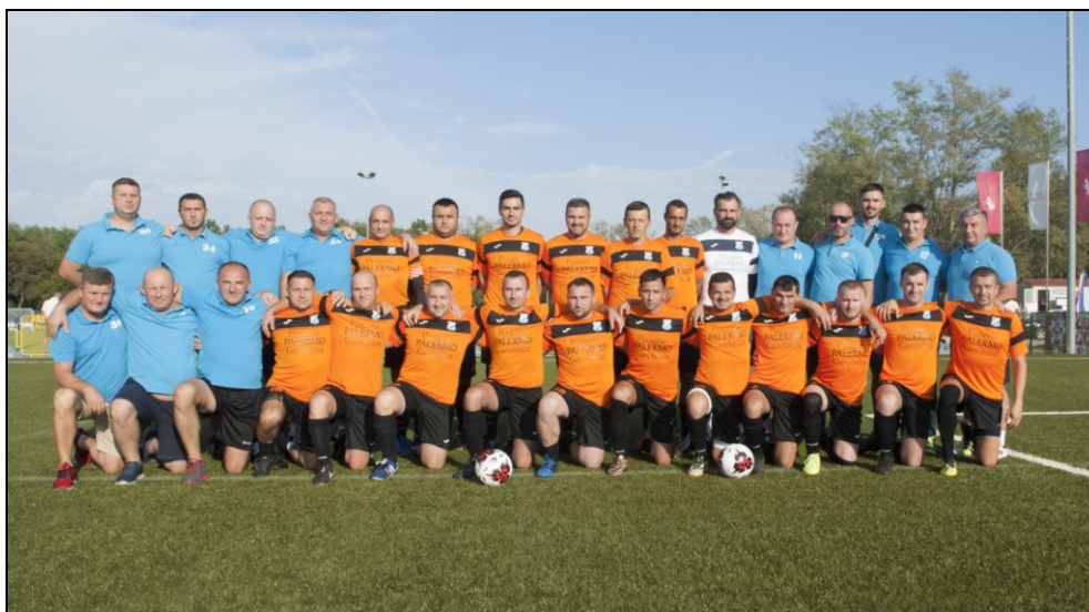
momčad veterana NK Garić – Garešnica