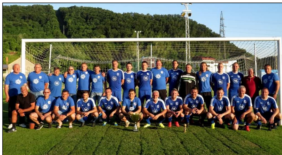
Prvaci I ŽNL veterana NS KZZŽ, sezona 2020./2021., Zagorec, Krapina veterani