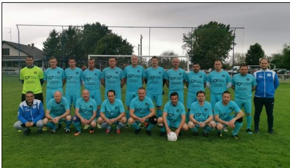
Prvaci skupine „B“ LV MNS, sezona 2020./2021., veterani NK Nedelišće