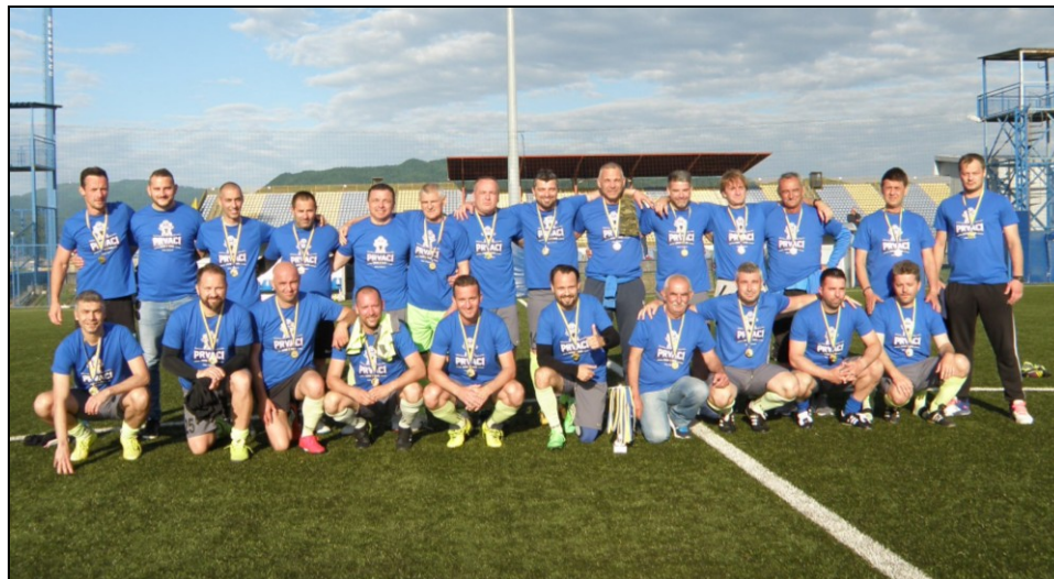
Prvaci LV NS Zaprešić, sezona 2020./2021., veterani Zaprešić