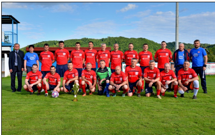
Prvaci lige veterana Skupina „Zapad“, sezona 2020./2021., Hrašćica