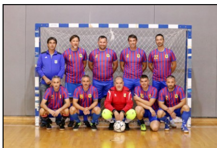
MNK ZLATNA RIBICA