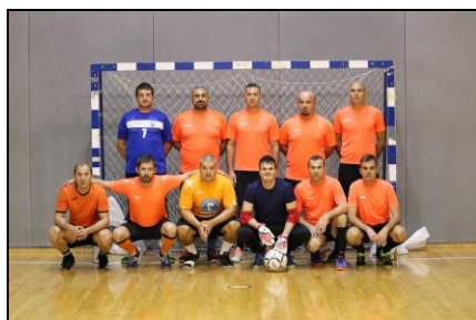
MNK STARI GRAD