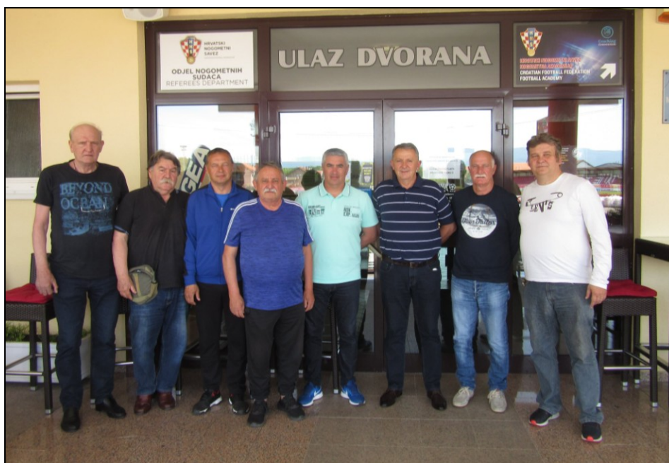
Sjednica Komisije za veteranski nogomet IO HNS-a, Sesvete, lipanj 2021.

VAŽNO: Sve najnovije vijesti o veteranskom nogometu možete redovito pratiti na Internetu i web adresi: www.hns-cff.hr (HNS - Grassroots – Veteranski nogomet) – Vijesti, Nastupi selekcije veterana HNS-a, Prvenstva pri Županijskim nogometnim savezima i središtima (rezultati i tablice po kolima).