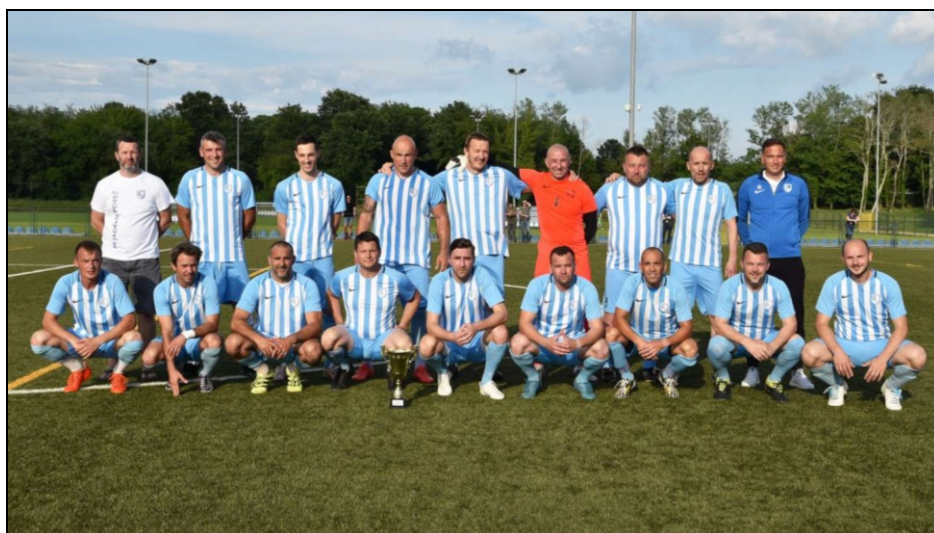
Prvaci skupine „Sjever“ sezona 2020./2021., veterani Jadran Poreč