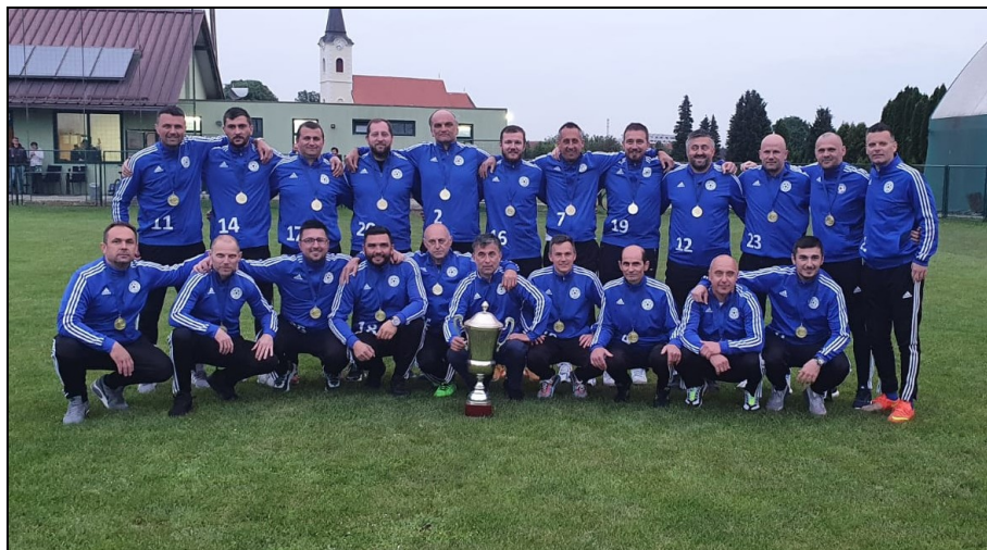
Prvaci 1. Lige skupina „A“ ZNS-a, sezona 2020./2021., VNK Polet sveta Klara