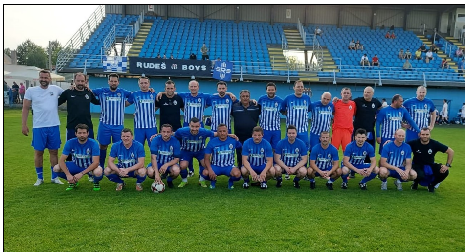
Prvaci Premier lige, ZNS-a, sezona 2020./2021., VNK Lokomotiva Senjak hoteli