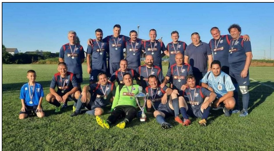
Prvaci LV NS Jastrebarsko, sezona 2020./2021., Zrinski Ozalj veterani