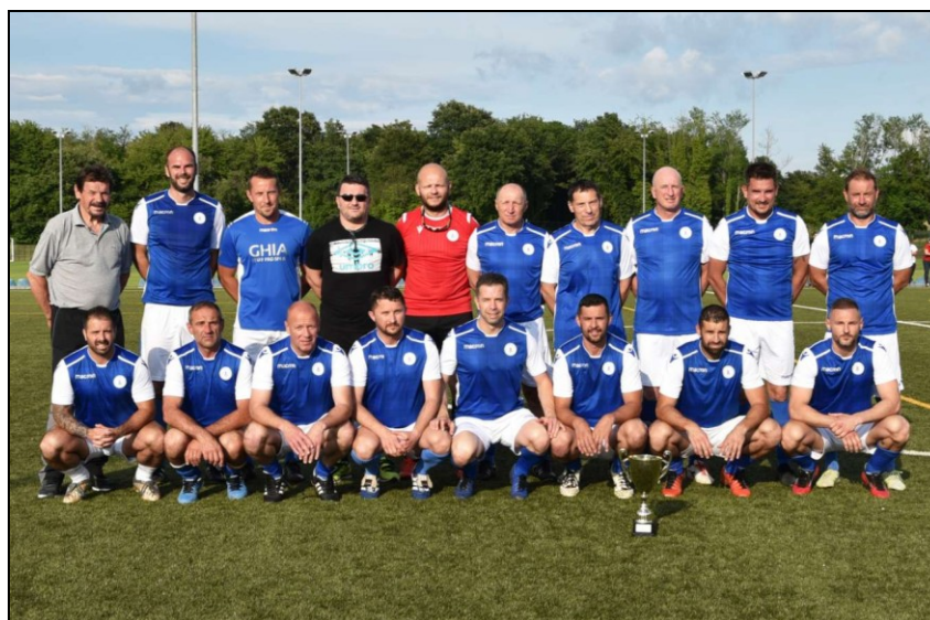
Prvaci skupine „Centar“ sezona 2020./2021., Pazin veterani