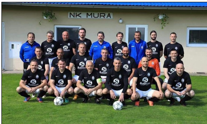
Prvaci skupine „Sjeverozapad“ LV MNS, sezona 2020./2021., NK Mura