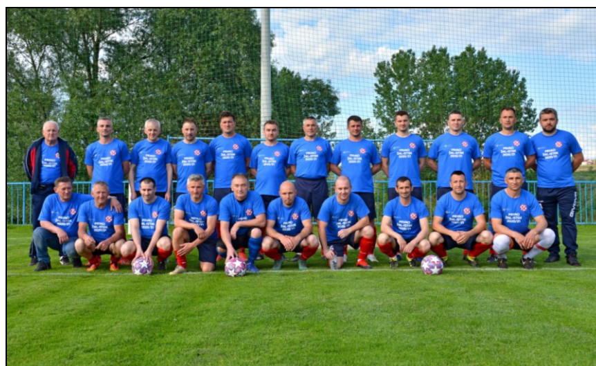
Prvaci lige veterana Skupina „Istok“, sezona 2020./2021., Polet Tuhovec