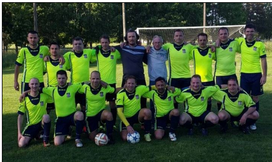
Prvaci 2. Lige skupina „B“ ZNS-a, sezona 2020./2021., Ravnice Zagreb