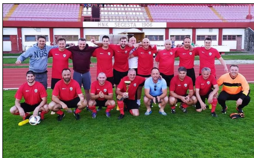
Prvaci lige veterana NS Sisak, sezona 2020./2021., Segesta, Sisak