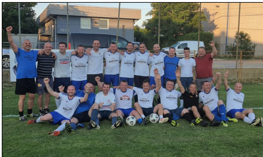
Prvaci LV NS Samobor, sezona 2020./2021., TOP Kerestinec veterani