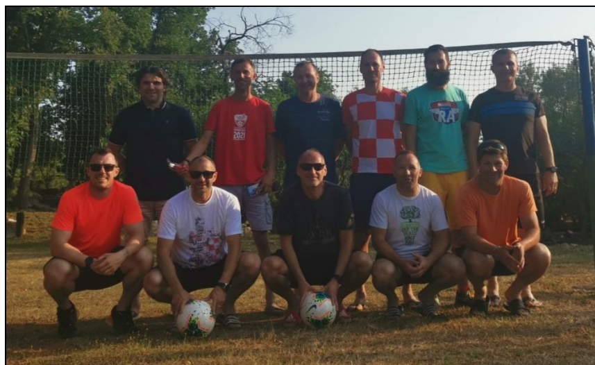
Prvaci skupine „Jug“ sezona 2020./2021., veterani Istra, Pula